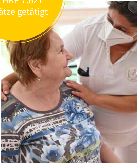
Wir bieten Betreuung und Pflege, Verständnis und vor allem auch menschliche Zuwendung.

2023 hat das Team der HKP 7.627 Einsätze getätigt