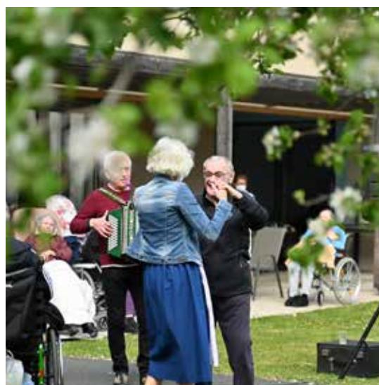
Gemeinsame Aktivitäten sind wichtige Fixpunkte, um ein Zusammenleben mit Wohlfühlfaktor zu schaffen.

Das Pflegewohnhaus Bernstein liegt zentral im Ortskern von Bernstein und verfügt über 35 Langzeitpflegebetten. Durch die Lage wird die