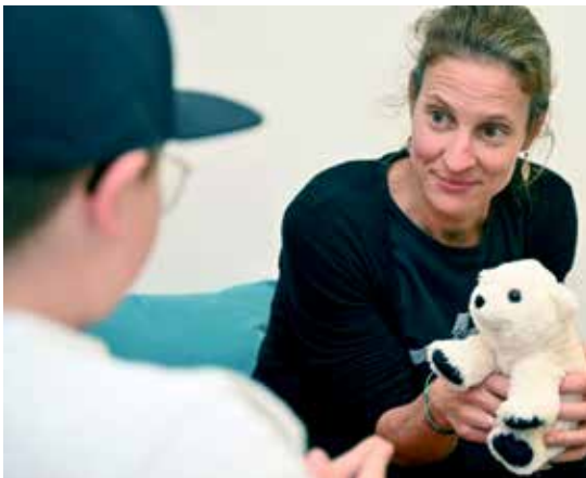
Die Kinder und Jugendlichen werden von einem multiprofessionellen Team betreut.

D as Ziel ist es, einen wirksamen Interventionsplan zu erarbeiten, der nach der Entlassung des Kindes/Jugendlichen gut umsetzbar ist. Ein stationärer Aufenthalt dauert mehrere Monate, während dieser Zeit besuchen die Kinder und Jugendlichen