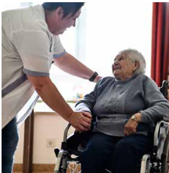
Die Bewohnerinnen und Bewohner erhalten Unterstützung in allen Bereichen des täglichen Lebens.

Das Pflegewohnhaus Neudörfel – St. Nikolaus verfügt über 153 Pflege- und Betreuungsplätze und ist das größte Pflegewohnhaus des Bur-